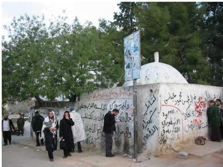
Гробница Иисуса Навина в Кифль Харес.

В 622 г. до н.э. Иосия окончательно запретил все языческие культы на территории Иудеи, были разрушены все алтари идолопоклонников. Потому нет ничего удивительного в том, что создатели Книги Иисуса Навина с такой ненавистью расправились на словах с идолопоклонниками, объявив их поголовное истребление волей Бога – справедливой и не подлежащей осуждению. Одним словом, таковы были мечты древних иудеев.