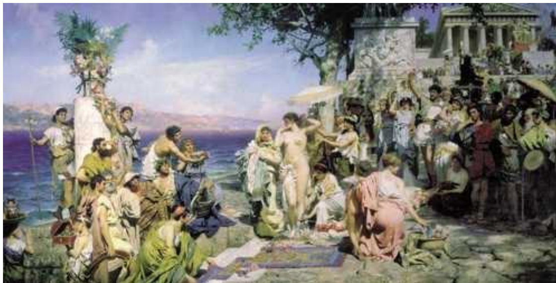
Фрина на празднике Посейдона в Элевсине. Художник Г. Семирадский

Древняя Греция (особенно Афины) была знаменита своими гетерами – образованными, умными женщинами легкого поведения, обеспечивавшими себе роскошную жизнь за счет богатых любовников. Имена некоторых из них сохранились в истории, а три гетеры даже удостоились вечной великой славы. Первая была гетерой по слухам. Ее звали Аспазией, и она вышла замуж за народного вождя Перикла, а после его кончины стала женой торговца скотом Лизикла, которого тоже сделала народным вождем. О ее принадлежности к стану гетер споры идут вот уже полторы тысячи лет – ведь сам факт замужества вроде бы разрушает такую версию. Но чего не бывает в жизни. Имя второй – Фрина. Она по сей день признается самой красивой женщиной древности. Ну и, конечно же, третья – Таис, по наущению которой Александр Македонский сжег столицу Древней Персии город Персеполь. Все три женщины жили в Афинах.