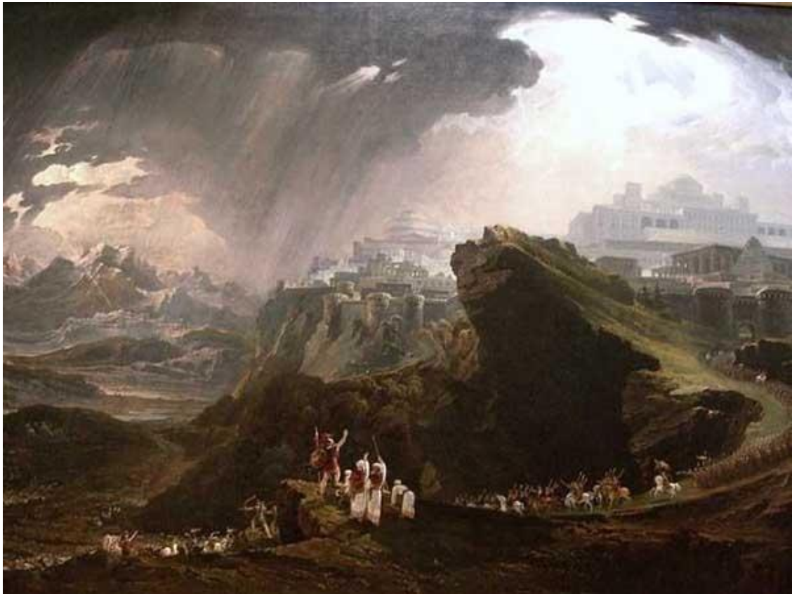
Иисус Навин останавливает солнце над Гаваоном. Художник Дж. Мартин

не осталось [ни одного] из Енакимов в земле сынов Израилевых, остались только в Газе, в Гефе и в Азоте» (Нав. 11:19—22).