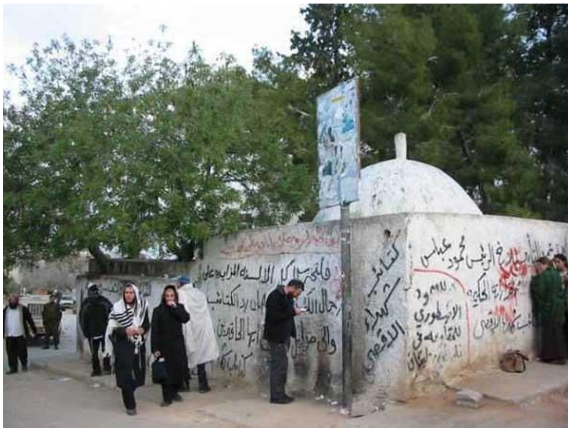
Гробница Иисуса Навина в Кифль Харес.

В 622 г. до н.э. Иосия окончательно запретил все языческие культы на территории Иудеи, были разрушены все алтари идолопоклонников. Потому нет ничего удивительного в том, что создатели Книги Иисуса Навина с такой ненавистью расправились на словах с идолопоклонниками, объявив их поголовное истребление волей Бога – справедливой и не подлежащей осуждению. Одним словом, таковы были мечты древних иудеев.