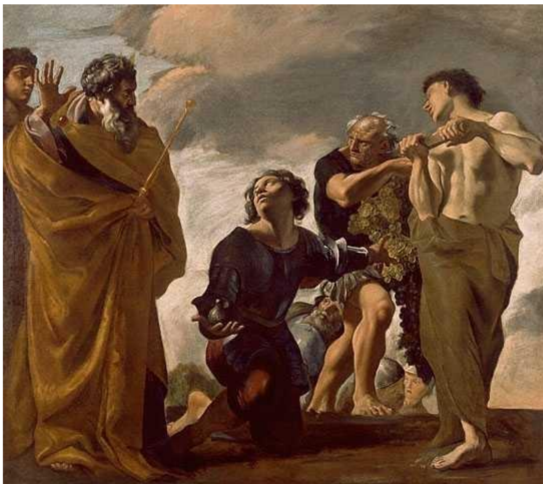
Моисей и разведчики, вернувшиеся из Ханаана. Художник Дж. Ланфранко.

В Библии (Ветхом Завете) есть свой Иисус – человек Иисус Навин. Он был любимцем Иеговы и непосредственным преемником пророка Моисея, после смерти которого привел евреев в Ханаан 1 и завоевал его.