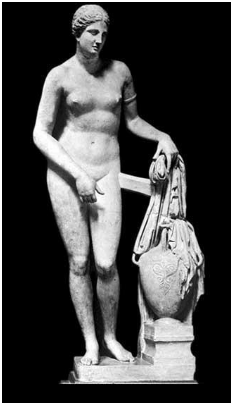
Афродита Книдская. Копия со скульптуры Праксителя

Скульптор изваял две статуи: одна – Афродита в хитоне и пеплосе, она скорее напоминала уважаемую матрону; вторая была полностью обнажена. Подобного мир еще не видывал. Так была заложена основа традиции древнегреческой скульптуры – изображать богов обнаженными и со всеми подробностями, но непременно с идеальным телом.