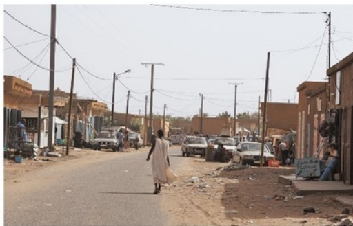
Обычная улица в обычном городке