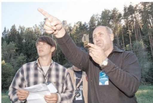
«Двадцать пар шагов в этом направлении»