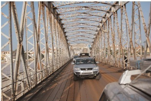
Тот самый разводной мост Файдербе в Сен-Луи