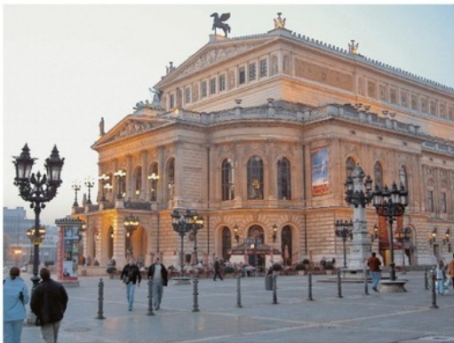
Франкфурт. Здание оперы