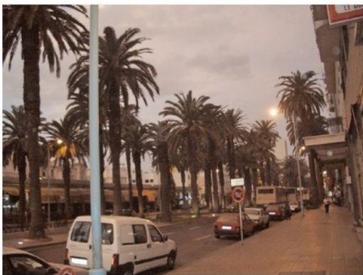
Но это все до окончания вечерней молитвы