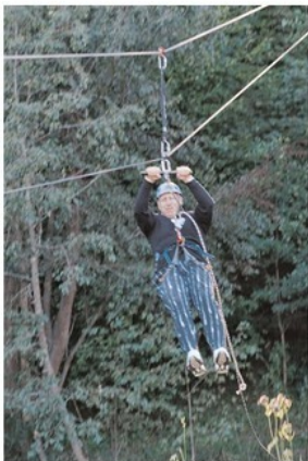
Что будет раньше: земля или пенек?