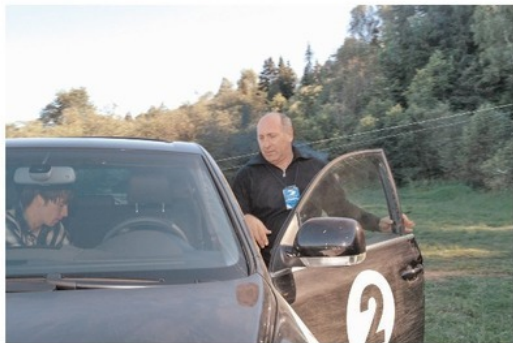
Смена за рулем после очередного испытания