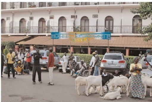
Площадь перед гостиницей в Сен-Луи