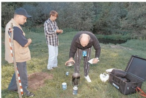
Ну когда уже закипит вода?