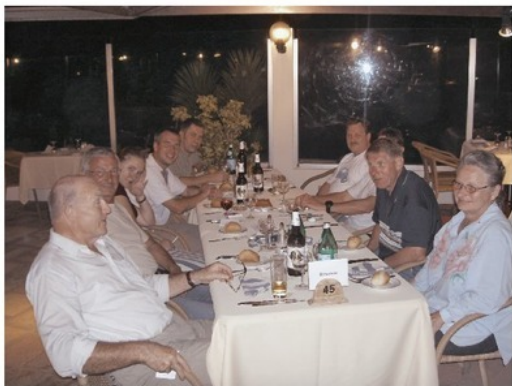
Первый раз в полном составе