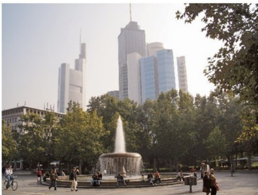
Контрасты современного города