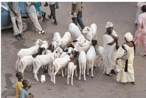
У каждого свои разговоры, пока разведен мост