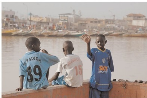
Футбольный фанат Аленичева, причем там, где Аленичева никогда не видели