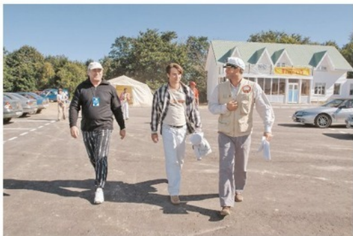
Пора на трассу испытаний