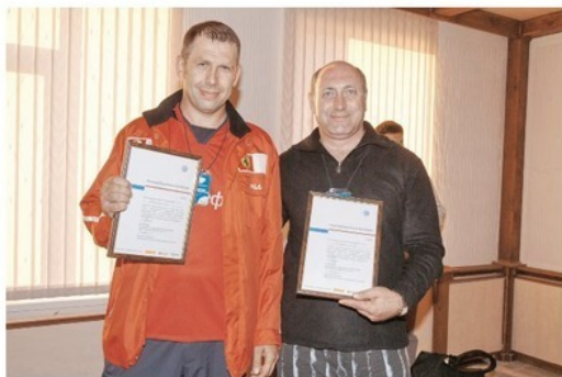
Мы участники экспедиции!!!