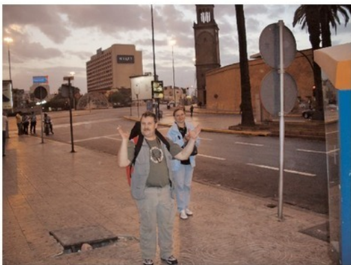
На улицах редкие прохожие, например — мы