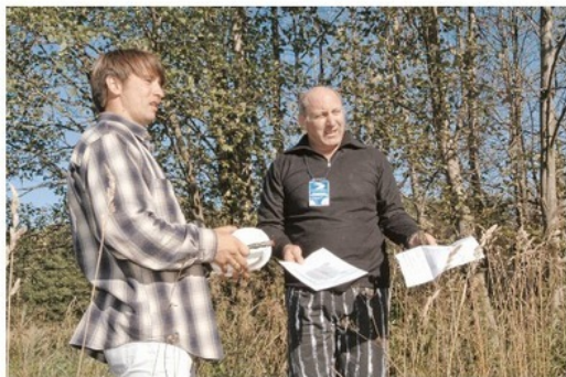
Мы точно вышли на отметку