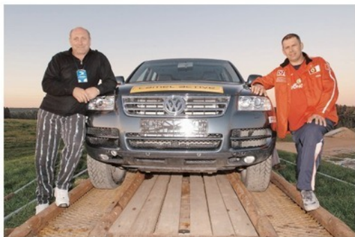
Он нам помог победить