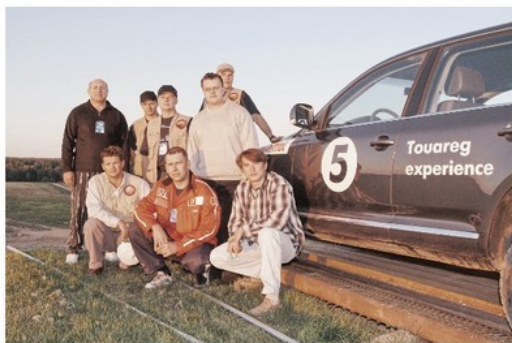
Совместное фото «Экспертов приключений» и участников финального отбора