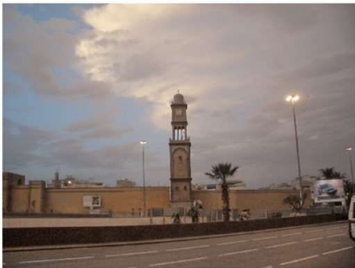
Касабланка. Город словно вымер