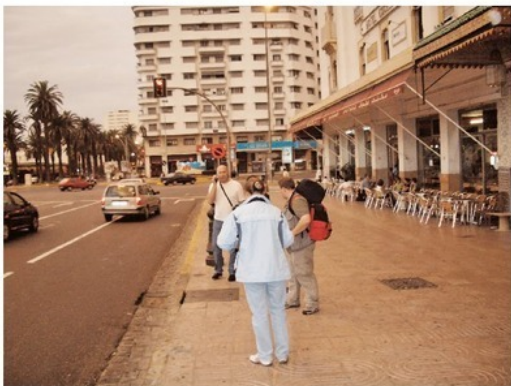
В кафе редкие посетители