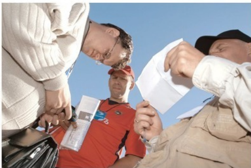
«Забивка» координат в навигаторы