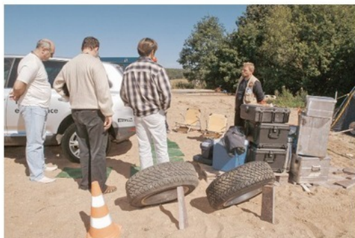
Экипировка экспедиционного «Туарега»