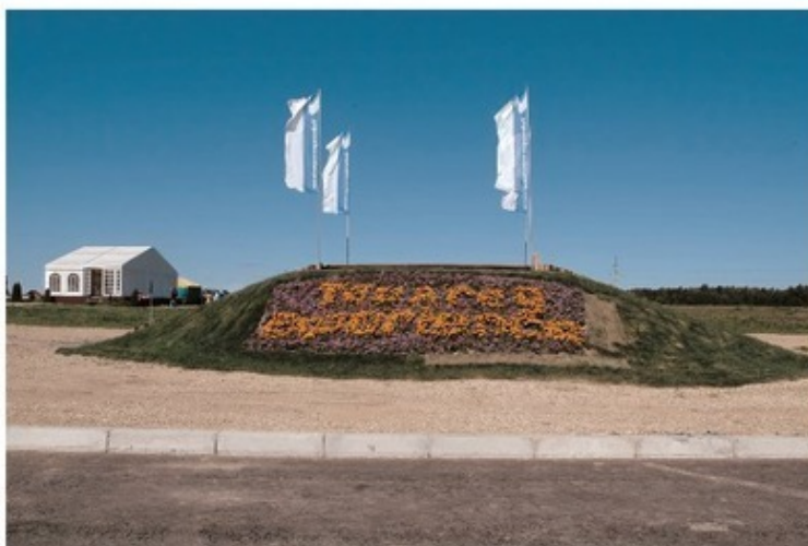
Touareg Experience приглашает