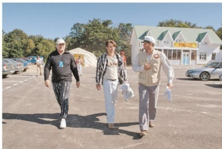
Пора на трассу испытаний