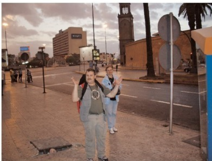
На улицах редкие прохожие, например — мы