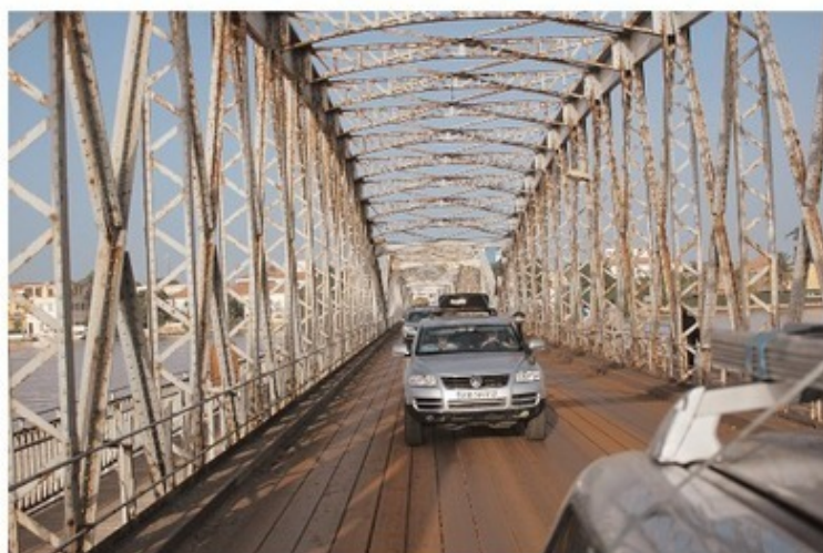
Тот самый разводной мост Файдербе в Сен-Луи