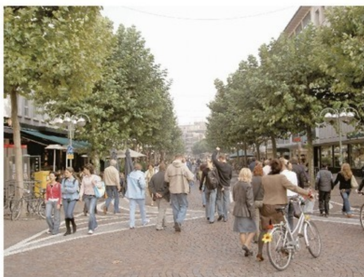
По такой аллее приятно погулять