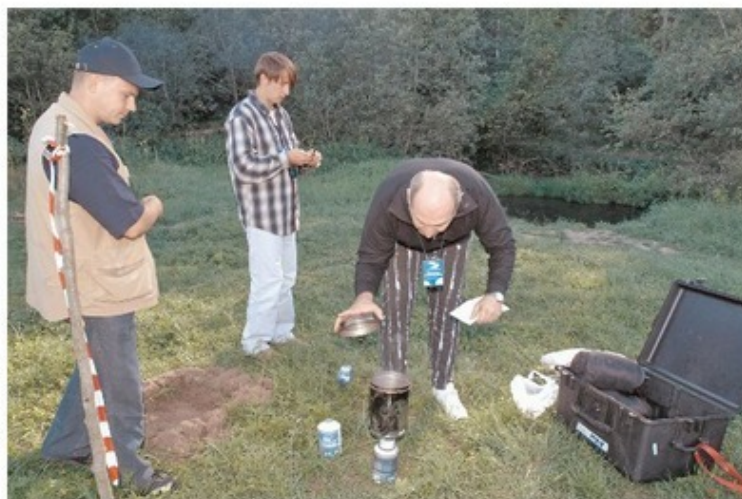
Ну когда уже закипит вода?