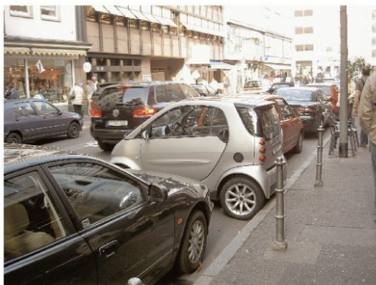
Хорошо быть маленьким