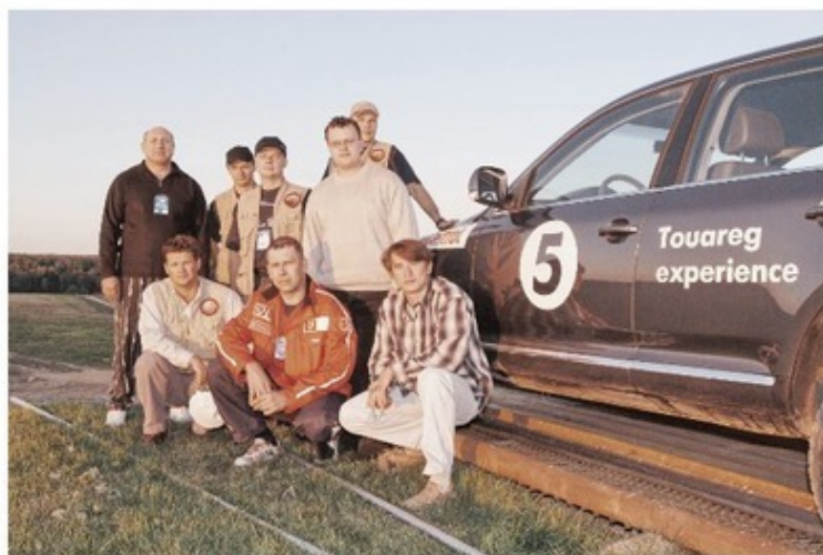
Совместное фото «Экспертов приключений» и участников финального отбора