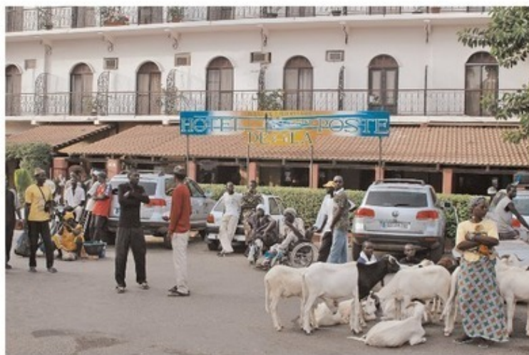
Площадь перед гостиницей в Сен-Луи