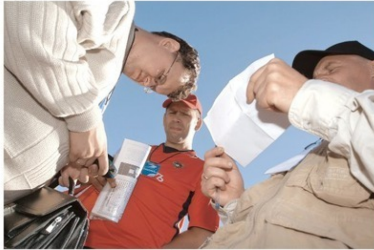
«Забивка» координат в навигаторы