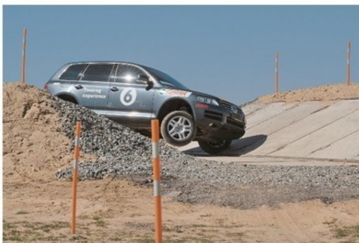
Диагональное вывешивание — жестокое испытание на надежность