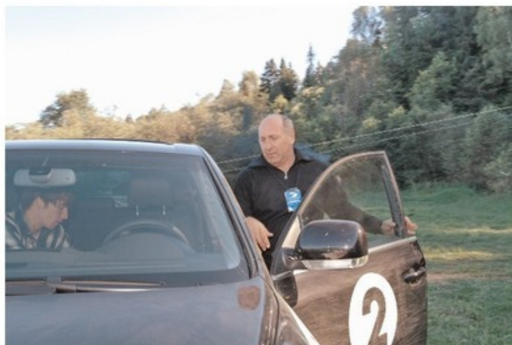
Смена за рулем после очередного испытания