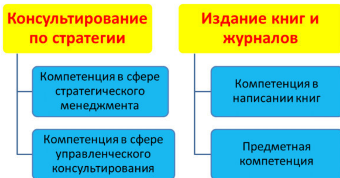
Рис. 1. Наши базисные (корневые) продукты

Нашим продуктом, имеющим отношение к рассматриваемому стартапу, являются услуги по разработке стратегии. Для производства этого базисного (корневого) продукта мы опираемся на соответствующие компетенции: знания и опыт в сфере стратегического менеджмента и знания и опыт в сфере управленческого консультирования. Другой наш базисный продукт – это издание книг в сфере менеджмента (см. рис. 1).