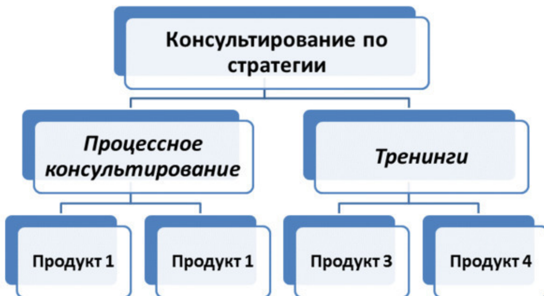
Рис. 2. Конечные продукты как результат деятельности.

Консультирование по стратегии – это корневой (базисный) продукт нашей компании.