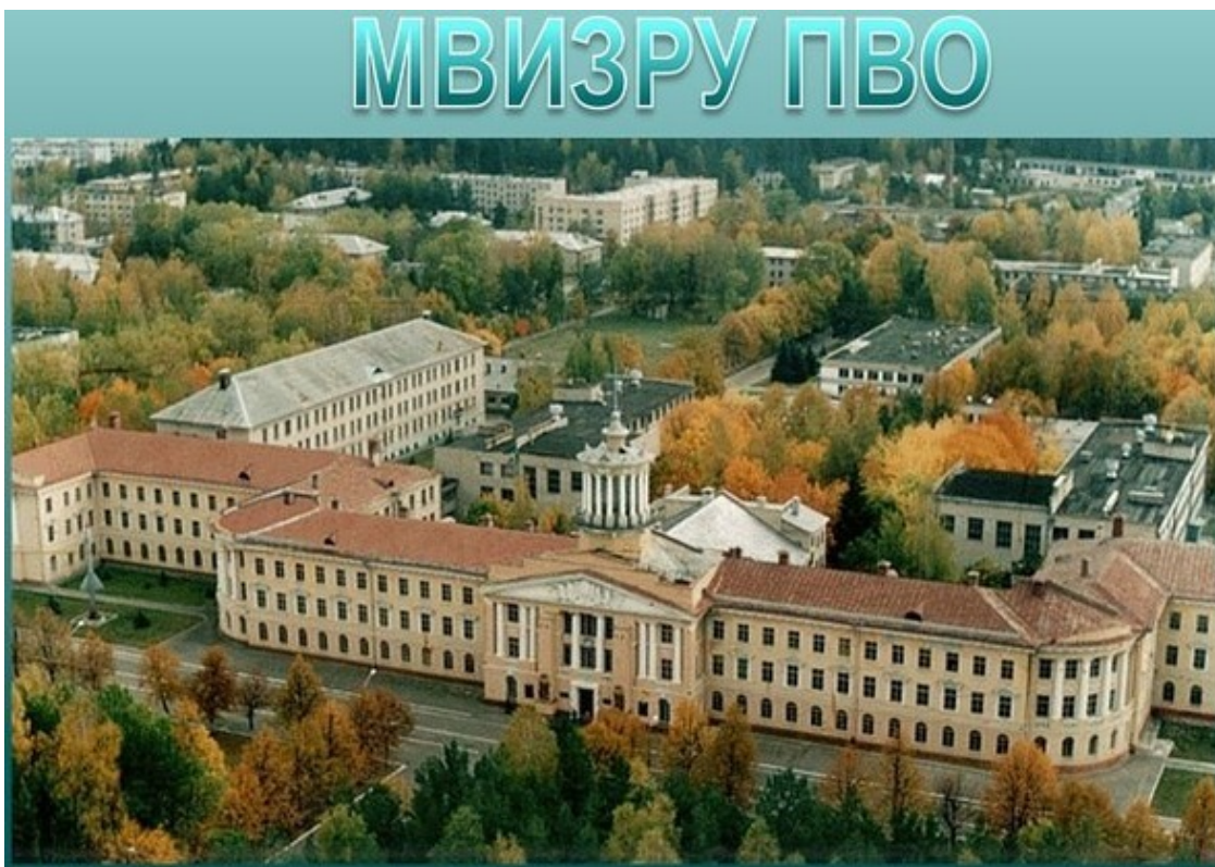
Фото 2. Комплекс зданий МВИЗРУ

Пока свободою горим, Пока сердца для чести живы, Мой друг, Отчизне посвятим, Души прекрасные порывы.