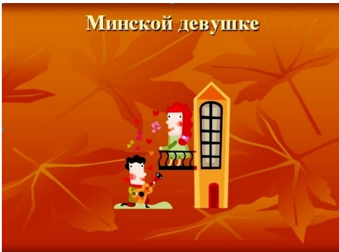
Рис.2. Минской девушке