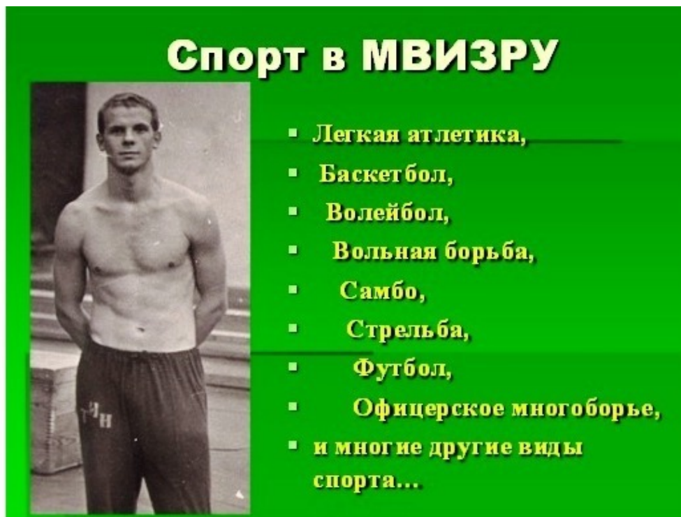
Фото 16. На занятиях спортом в МВИЗРУ