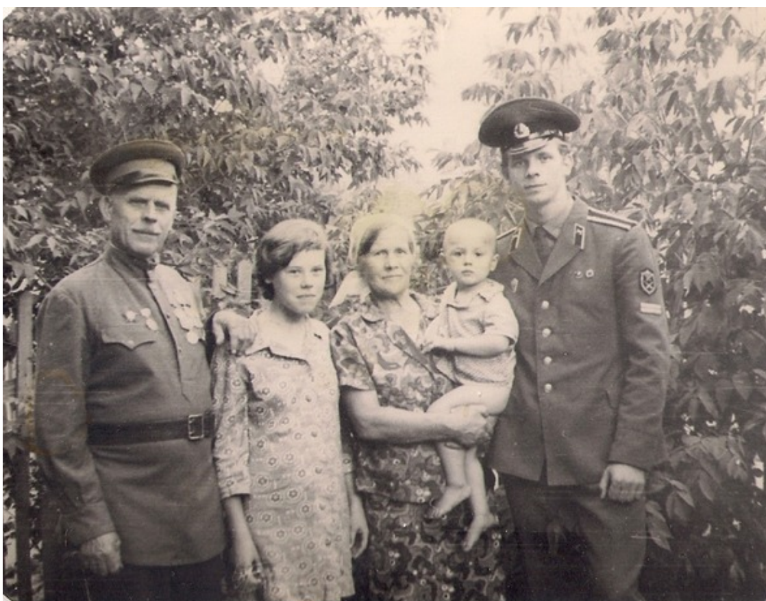
Фото 11. Первый летний отпуск встречаю с родителями

На мотив песни Высоцкого В. «Вершина» & В. Высоцкий. Вершина, муз.