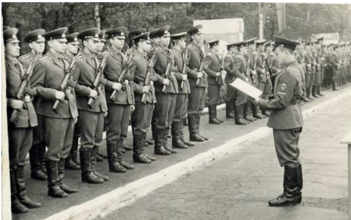
Фото 4. Принятие присяги

При поступлении в МВИЗРУ – трудились мы не зря, Сверкнули на вступительных здоровьем и талантом. Теперь мы можем прокричать «Ура!». Уж в сентябре зачислят нас в курсанты.