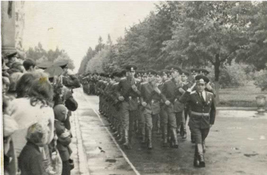
Фото 5. После зачисления в Училище – прохождение торжественным маршем

Вот и все. Мы больше не гражданские, Кроме униформы – ничего. На вид все одинаковы: тамбовские, саратовские, А что под гимнастеркою – поди, узнай его.