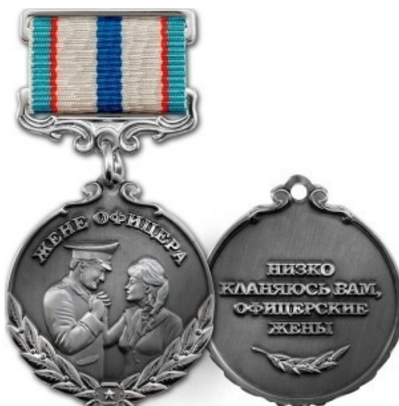
Фото 15. Медаль «Жене офицера»

В женах наших – потрясающая память, Помнят: счастье, радость и печаль. Им не страшна любая зАмять 16 , И что для них пусть знак или медаль?