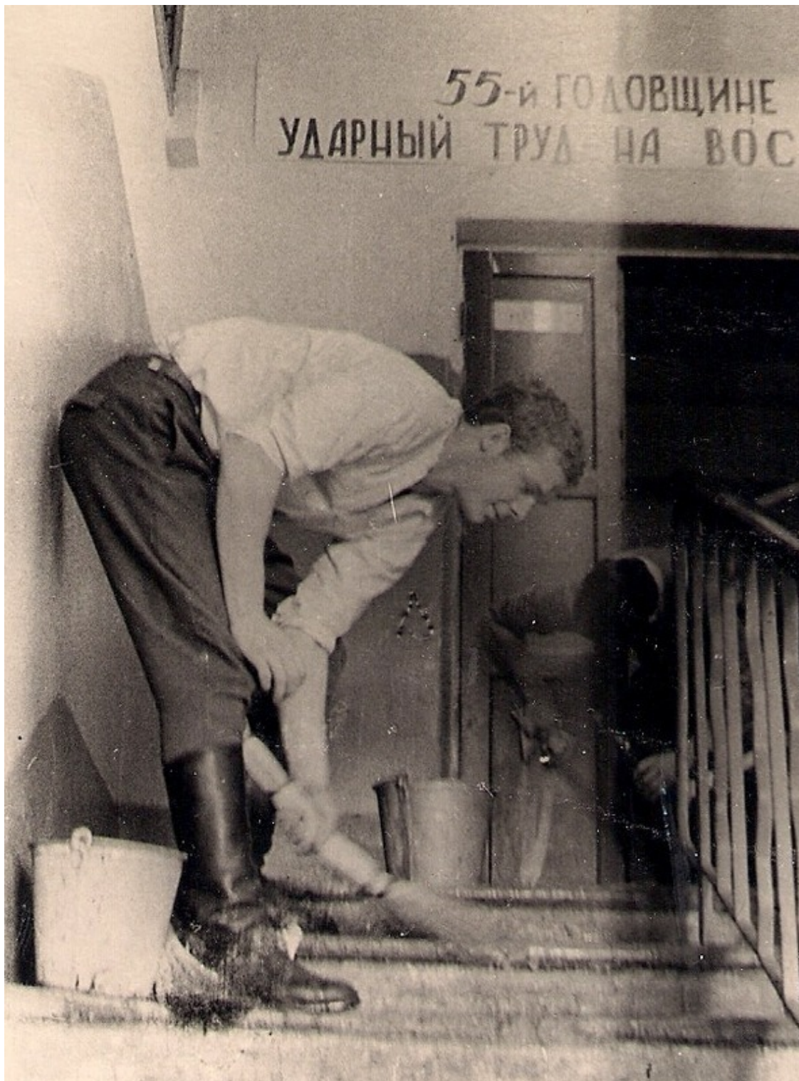
Фото 10. Казарма любит чистоту и порядок