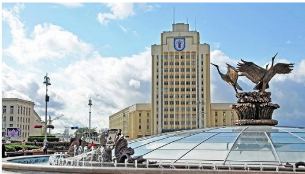
Фото 9. Минск. Перед Домом Правительства Республики Беларусь & Песняры. Беловежская пуца, муз.

Сапоги стучат по асфальту, Мокрые сапоги. Эта осень застала нас в МВИЗРУ, Курс еще один позади.