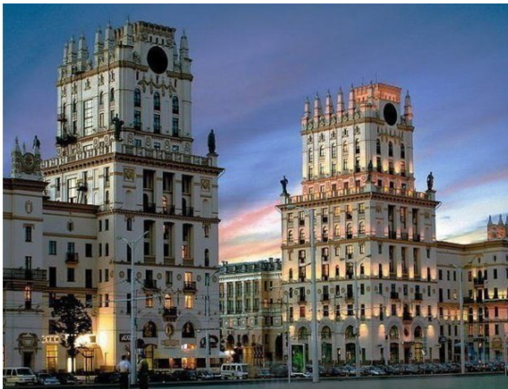
Фото 3. Парадные «ворота» белорусской столицы – города Минска

Мы выбираем путь, идем к своей мечте. И надо не свернуть в пути уже нигде. И стоит шаг пройти, заносит время след, Обратного пути у жизни просто нет.