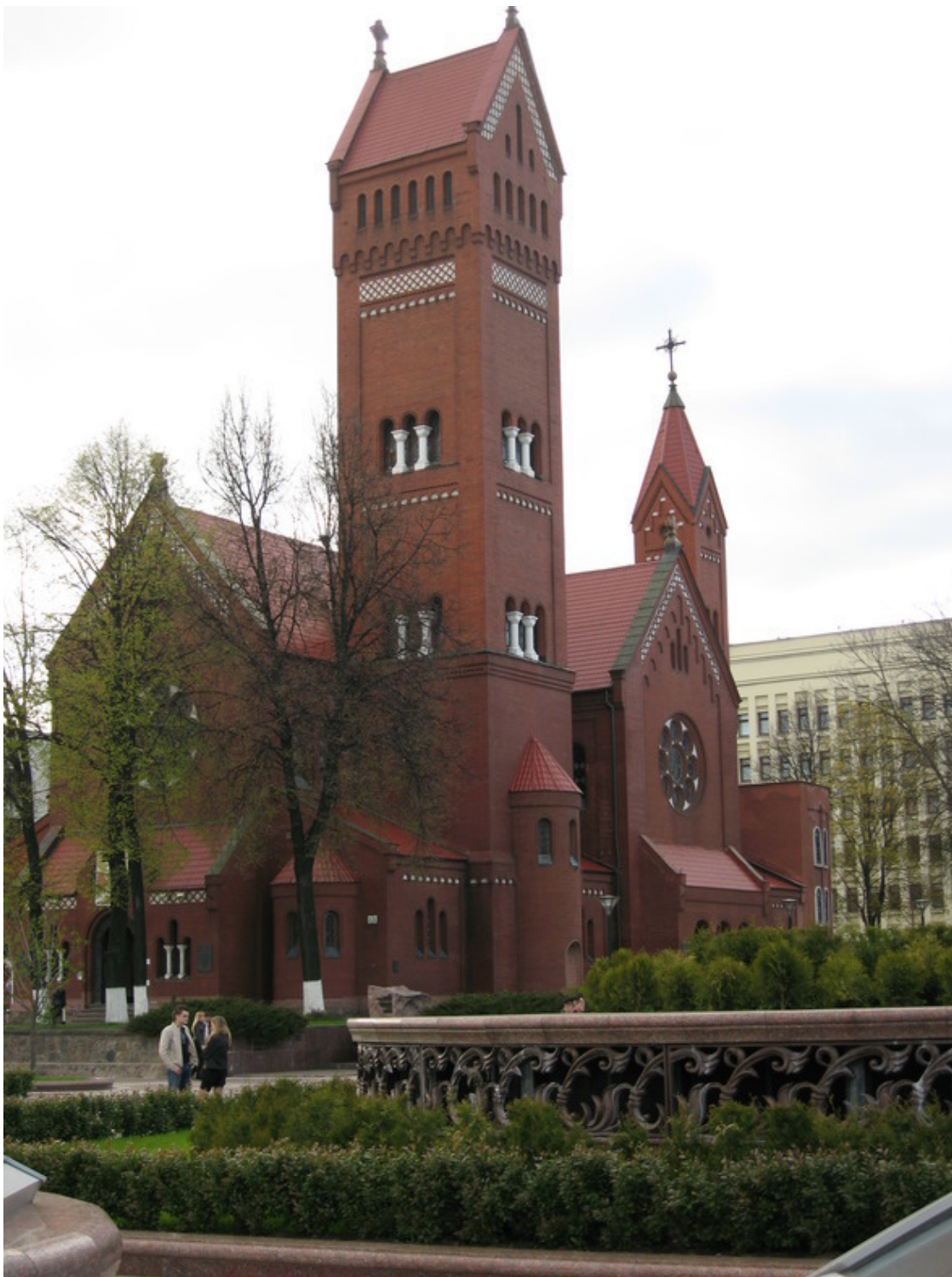
Фото 12. Главный кафедральный собор Республики Беларусь & Песняры. Молитва, муз.

«Отче наш! Иже еси на небеси, Да «Пресвятая Мать – демобилизация». Сохрани раба божьего – курсанта!