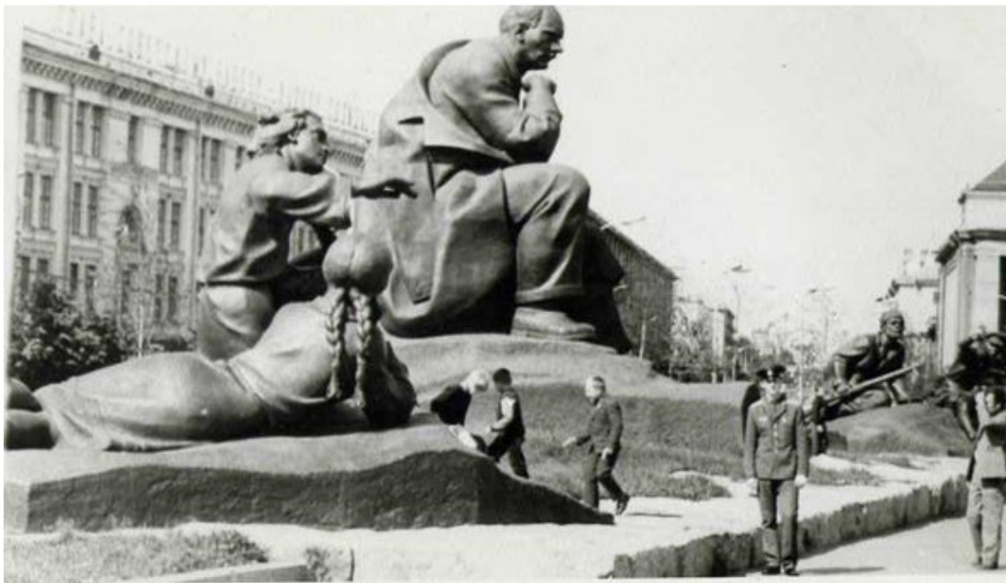
Фото 13. На площади Якуба Коласа в Минске & Песняры. Белоруссия, муз.

Дорогая моя Беларусь! Ты, как Русь, как берёзка белая!