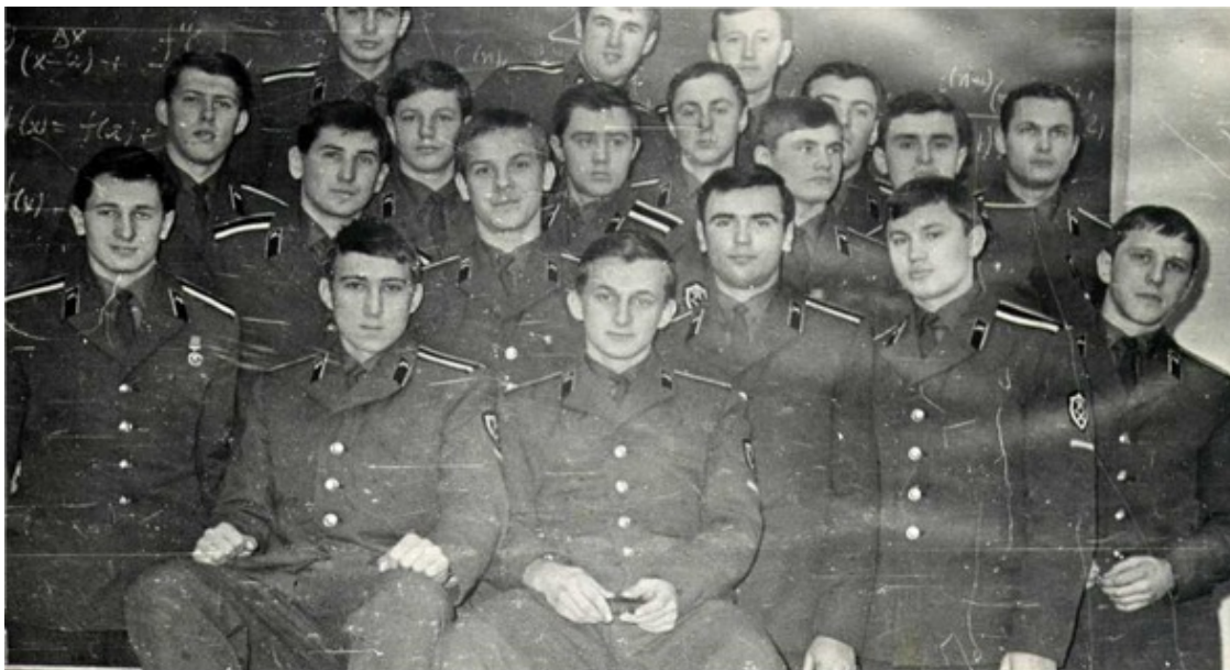
Фото 6. Первое курсантское фото на первом учебном занятии

«А я люблю военных, красивых, здоровенных...».