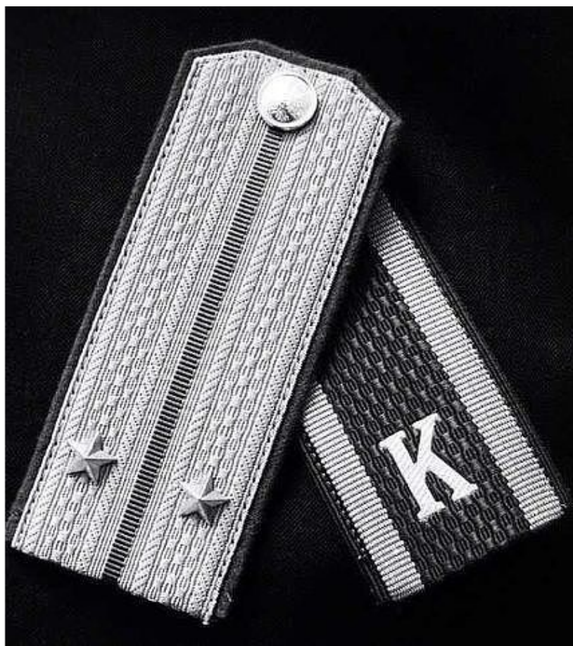
Рис. 1. Главная мечта курсанта – стать офицером &Песняры. Олеся, муз.

В нашем взводе разные ребята, Разные характеры и нравы. Но у всех одна мечта курсанта: Стать офицером и достичь какой-то славы.