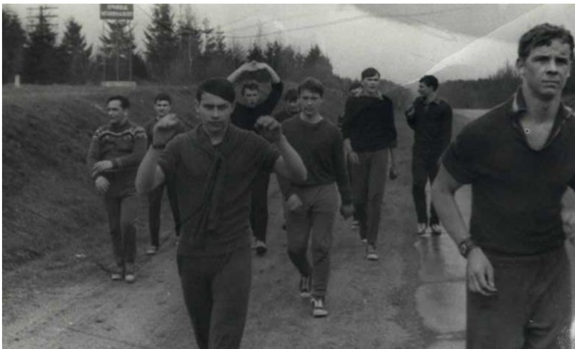
Фото 17. Кросс к Кургану Славы

Мы с первых дней служили честно, без обмана, Весной решили всем составом. Всем взводом пробежаться до Кургана, Который именуется – Курганом Славы.