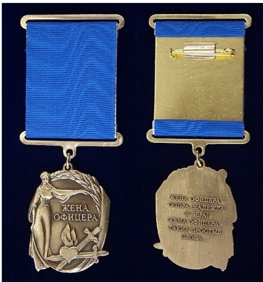
Фото 14. Почетный знак «Жена офицера»

Очень многие женщины любят военных, За красивую форму и бравую статью, Но не каждая женщина сможет, наверно, Решиться женой офицерскою стать.