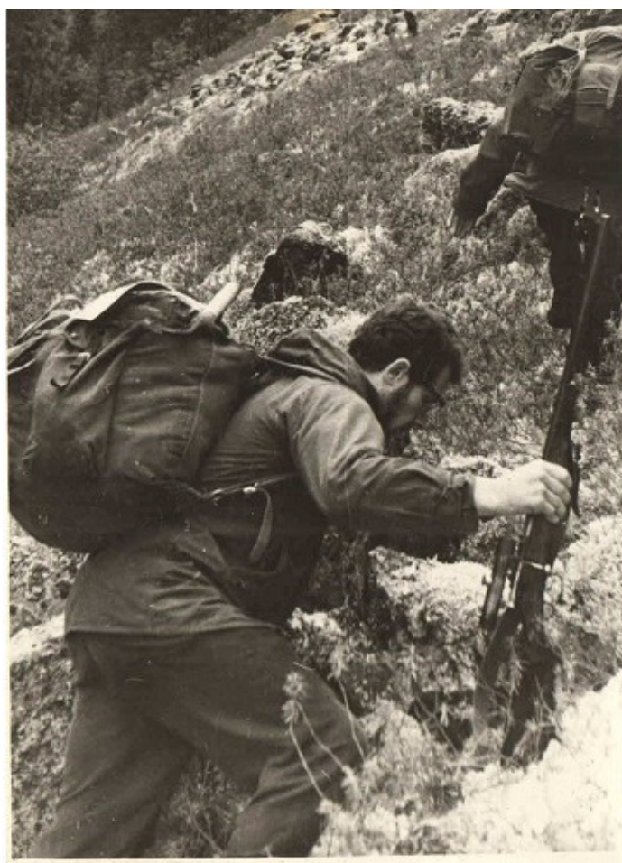
Лезу в гору я

Распивая очередную рюмочку «чая» и закусывая баночной тушенкой, местный начальник аэропорта, ехидно осведомившись о запасах оной, дает дельный совет: там, за речкой, «козлов» – умотаться, так же сидеть задаром, надо смотаться туда и добыть свежего мяса для всей честной компании. Сказано – сделано, и вот я на том берегу, переплыв на утлой лодчонке и снесенный метров на пятьдесят вниз по течению, сжимая в руках ТОЗ-17, начинаю храбро карабкаться по захламленной валежником лощинке вверх.