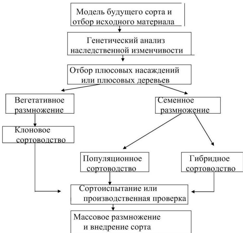
Рисунок 1 – Схема селекционного процесса и сортоводства лесных древесных пород

Все усилия науки и производства в области лесного хозяйства направлены на решение главной проблемы – сокращение периода воспроизводства лесных ресурсов и получение с единицы площади максимального количества высококаче-