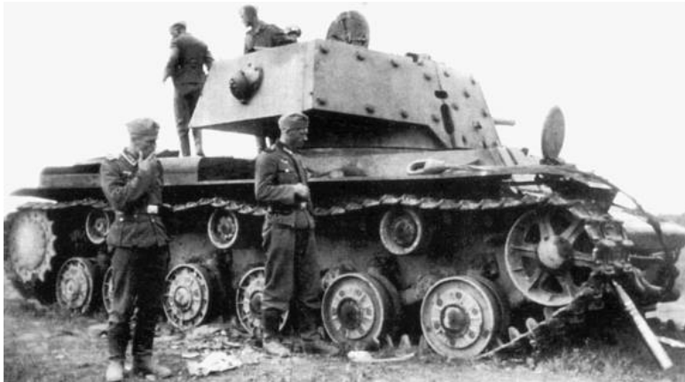
Немцы рассматривают брошенный экранированный танк KV. Август 1941 г.