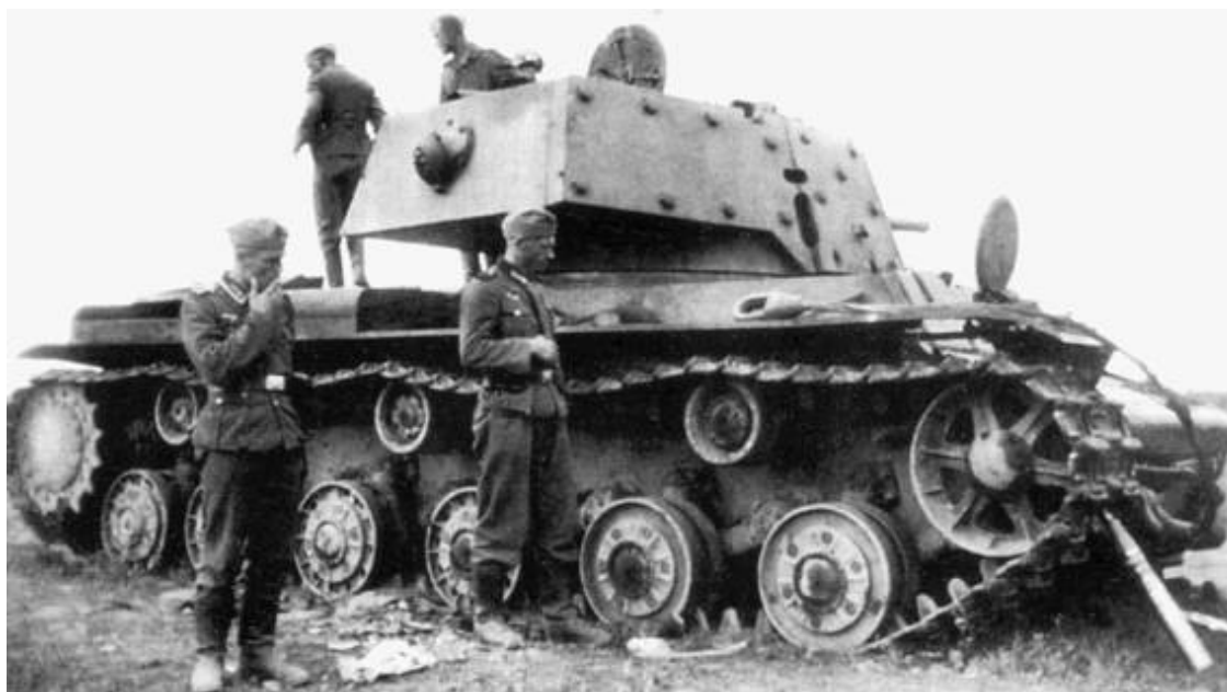
Немцы рассматривают брошенный экранированный танк КВ. Август 1941 г.