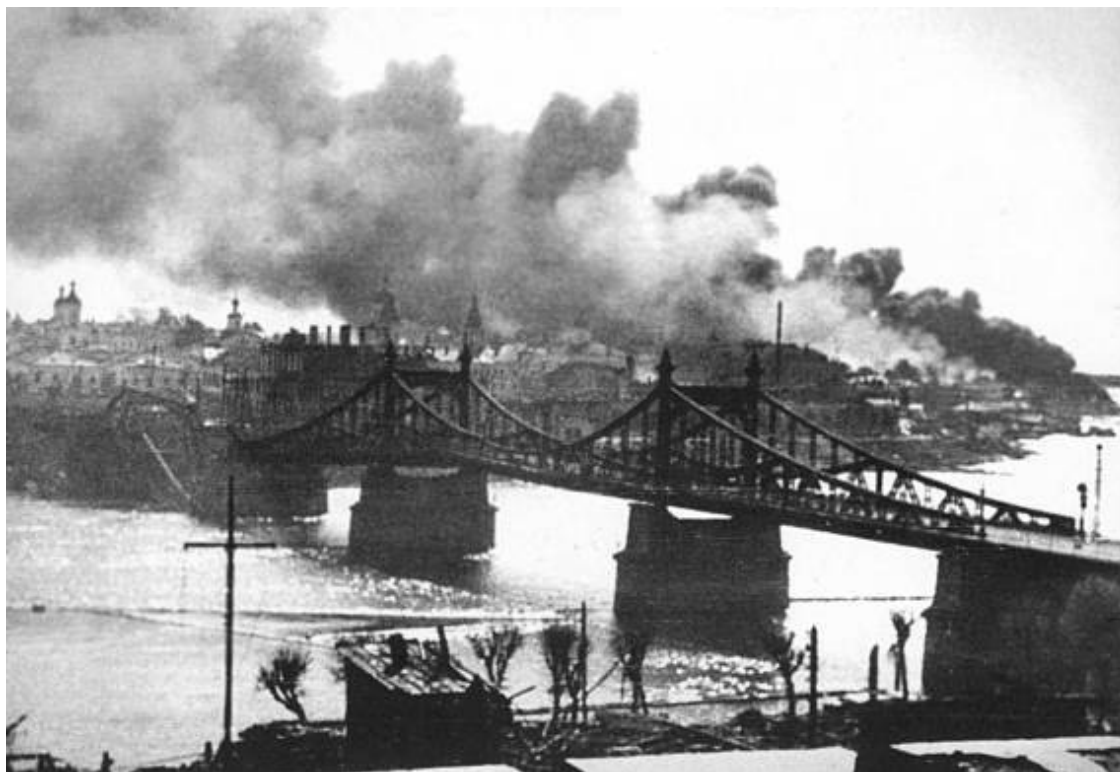
Новгород в огне: «сопротивление было подавлено атаками пикирующих бомбардировщиков, которые подожгли город во многих местах». Август 1941 г.

Начальник Генерального штаба Красной армии маршал Б.М. Шапошников 16 августа приказывал «Город Новгород не сдавать и держать до последнего бойца» 11 . В распоряжение командования Северо-Западного фронта Б.М. Шапошниковым направлялись свежесформированные 291-я, 305-я и 311-я стрелковые дивизии. Первая должна была занять рубеж реки Волхов, а вторая – оказать непосредственную поддержку войскам 48-й армии в боях за Новгород. Сражение за восточную часть Новгорода продолжалось до 19 августа. Основным его участником с советской стороны были остатки 28-й танковой дивизии полковника И.Д. Черняховского и 1-й горнострелковой бригады. Немецким войскам приходилось отбивать советские контратаки с применением танков, в ходе одной из которых 18 августа 3-й пехотный полк 21-й пехотной дивизии был полностью окружен. Однако мощная поддержка с воздуха в конечном итоге обеспечила немцам успех в боях за Новгород.