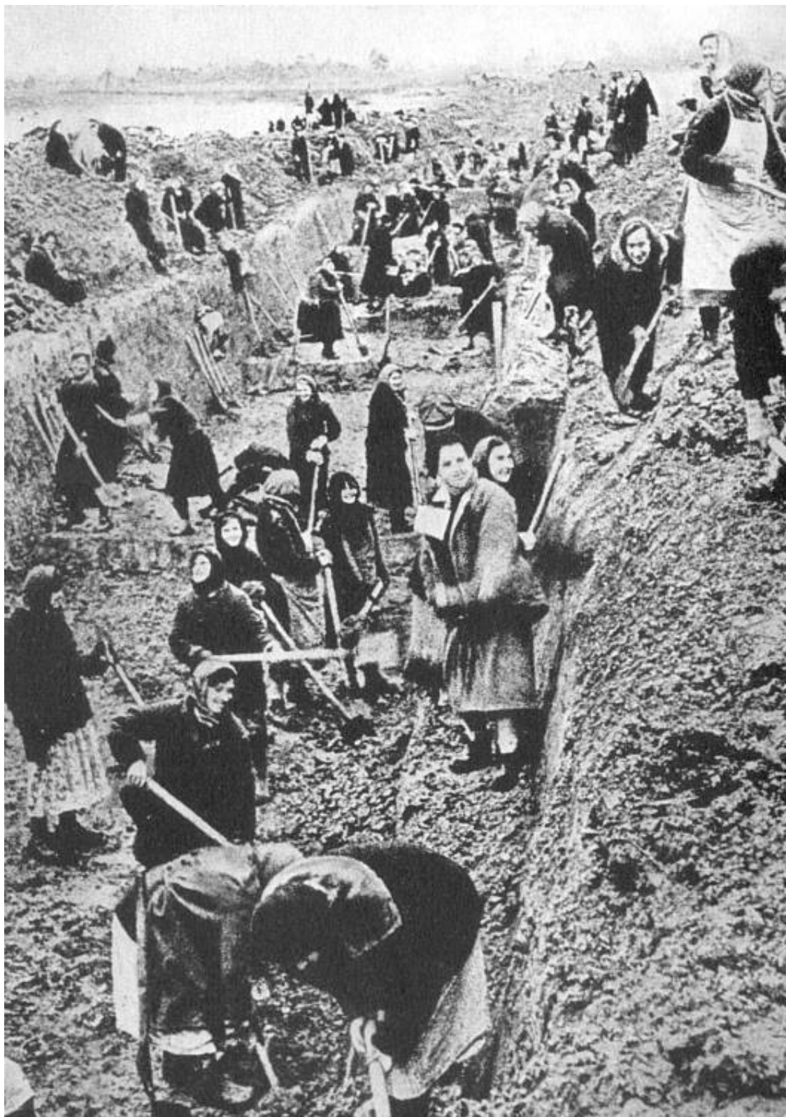
Женщины копают противотанковый ров. Летом – осенью 1941 г. на строительстве укреплений работали миллионы человек.

Вместе с тем нельзя утверждать, что вектор стратегии советского командования поменял знак. Наступление с целью вырвать стратегическую инициативу из рук противника было еще невозможно. Однако это не означало отказа от проведения наступательных операций локального значения. Даже в оборонительных сражениях воздействовать на обстановку командование