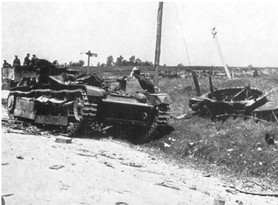
Разрушенный взрывом боекомплекта танк Т-28. Взрывом были сорваны все три башни. Орудийная башня лежит перевернутой рядом с танком.

Низкие плотности дивизий у границы и на рубеже «линии Сталина» можно было компенсировать большими массами техники, которая продлевала жизнь окружаемых армий. Быстро таявшие механизированные корпуса стали стальным щитом откатывавшихся от границы дивизий. Авиация часто становилась единственным средством воздействия на прорывающиеся глубоко в тыл моторизованные корпуса вермахта. К августу этот ресурс был практически исчерпан. Более того, РККА фактически лишилась как класса самостоятельных механизированных соединений масштаба танковой дивизии. Механизированные корпуса были расформированы. Вместо танковых дивизий начали формироваться танковые бригады, представлявшие собой организационные структуры непосредственной поддержки пехоты. Это означало принципиальную разницу в возможностях ведения операций РККА и вермахтом. Немецкая армия обладала инструментом для развития прорыва в глубину – танковыми и моторизованными дивизиями, объединенными в моторизованные корпуса. Красная армия была лишена крупных подвижных соединений, являвшихся наиболее эффективным средством парирования таких прорывов. Отражать удары немецких танковых клиньев предстояло передвигавшейся пешком пехоте. С предсказуемыми результатами.