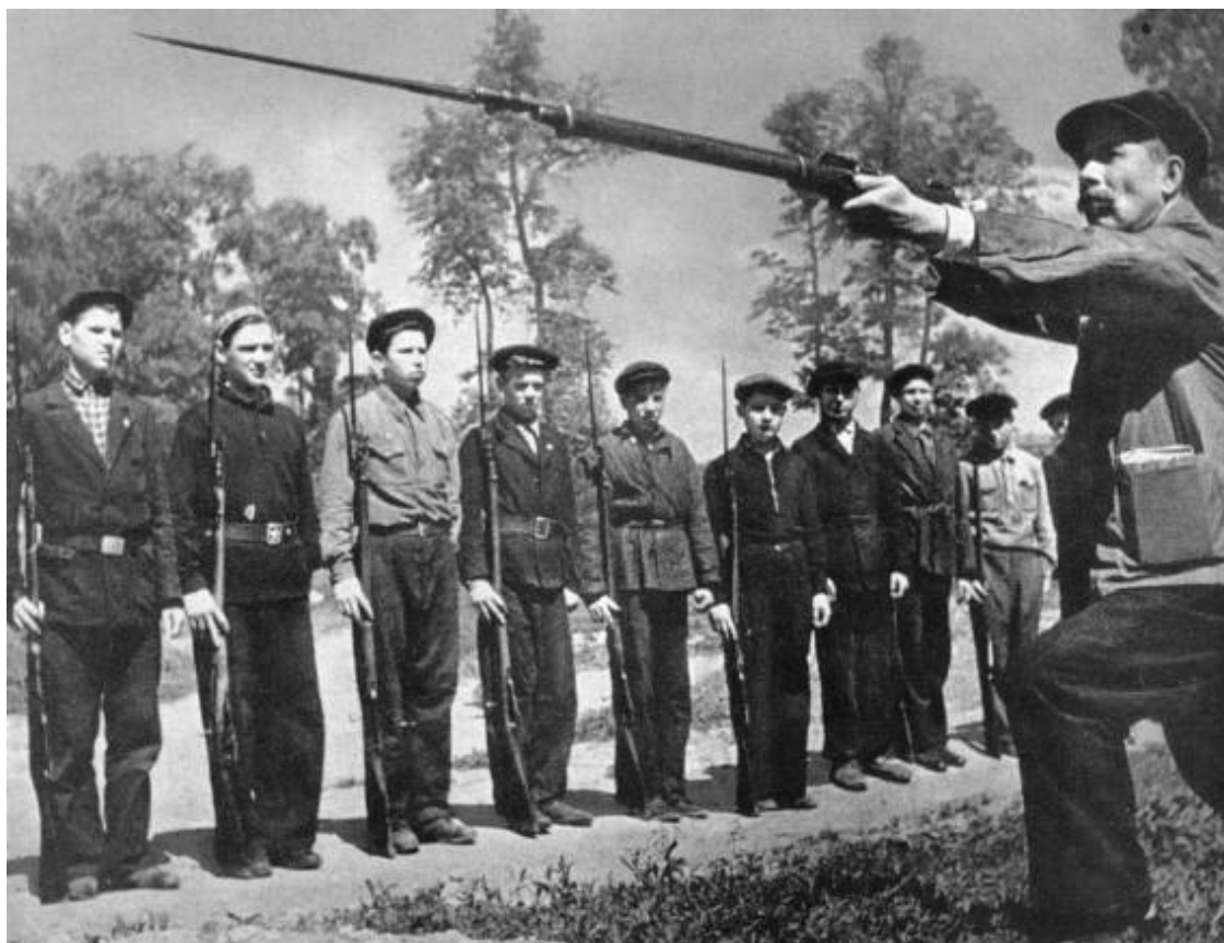
Ленинградские ополченцы проходят психологическую подготовку к грядущим боям – обучение штыковому бою.