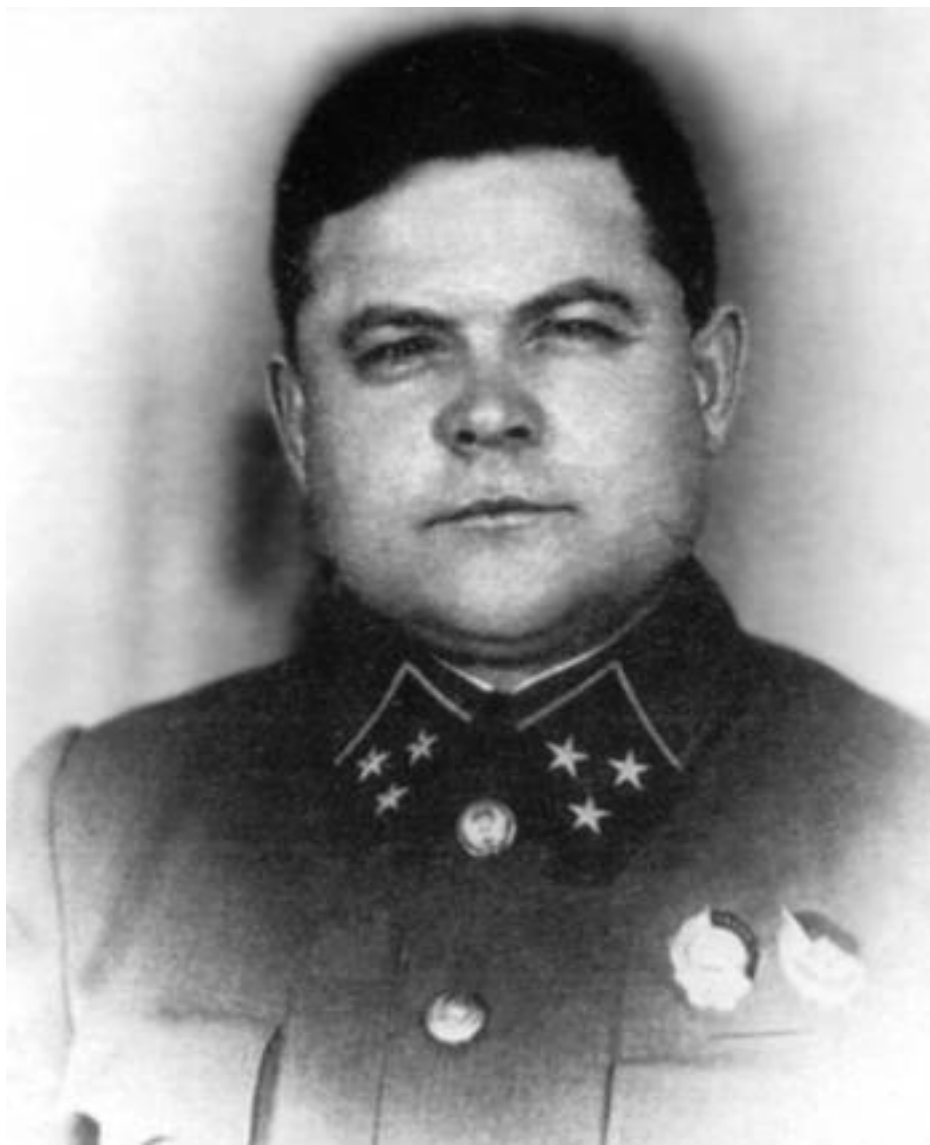
Начальник штаба Северо-Западного фронта Н.Ф.Ватутин.

Намеченный Н.Ф. Ватутиным и М.В. Захаровым темп наступления в 15 км в сутки подписавший директиву маршал Б.М. Шапошников считал завышенным. Он приказывал «при наступлении не зарываться вперед – ежесуточный темп продвижения иметь четыре-пять километров, обращая внимание на разведку и обеспечение своих флангов и тыла и на закрепление за собой пройденного пространства». Начало операции было назначено на 12 августа.