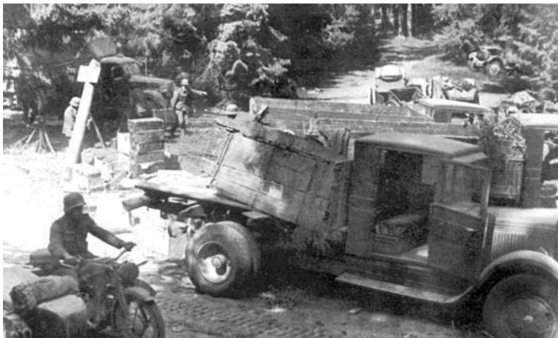
Советские грузовики ЗИС-5 брошенные в окружении под Лугой.

Ставкой ВГК в директиве № 00824 Северо-Западному фронту ставилась ограниченная задача: «нанесение поражения силам противника, группирующимся в районе Сольцы – Старая Русса, Дно, занять Старую Руссу и ст. Дно и закрепиться на рубеже последней» 12 . В операции должны были участвовать 11-я, 34-я, 27-я и 48-я армии. Задачи и исходные позиции для этих четырех армий обрисовывались в директиве следующим образом: