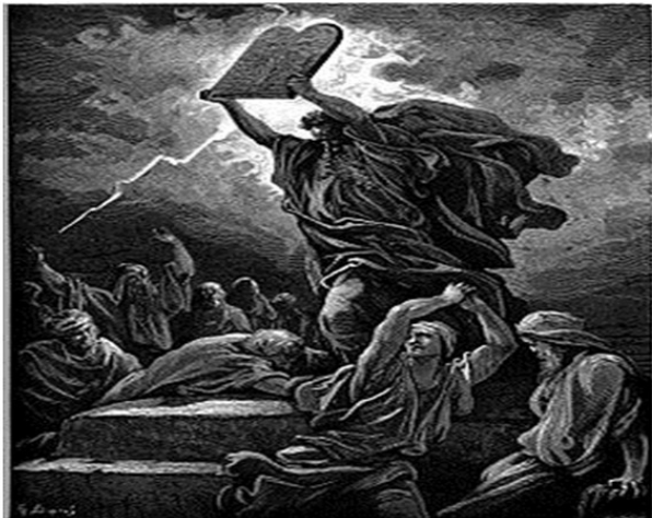
Гюстав Доре. Моше разбивает Скрижали.