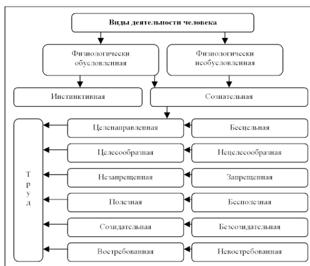
Рис. 3. Виды деятельности человека

1) биологическая (физиологическая, психологическая, психофизиологическая) – затраты физиологической энергии работников. Заключается в расходовании в процессе труда энергии мускулов, мозга, нервов, органов чувств.