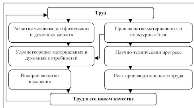
Рис. 4. Роль труда в развитии человека и общества

Роль труда в развитии человека и общества представлена на рис. 4.