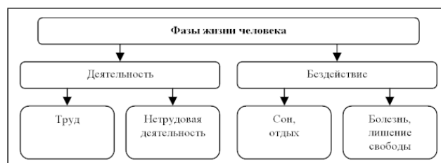
Рис. 2. Фазы жизни человека

В течение жизни человека, в каждый ее момент он находится в одном из двух состояний – деятельности или бездействия. На рис. 2 представлены фазы жизни человека.