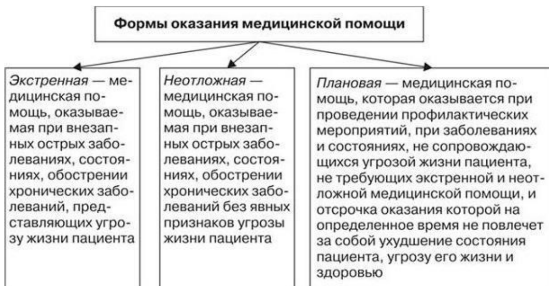
Схема 3. Формы оказания медицинской помощи и их содержание