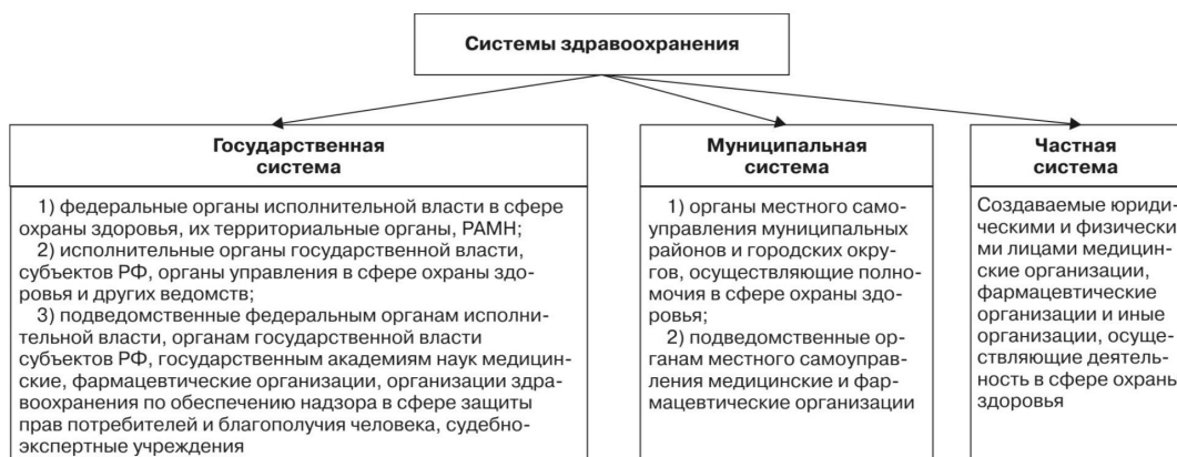
Схема 1. Системы здравоохранения и их структура