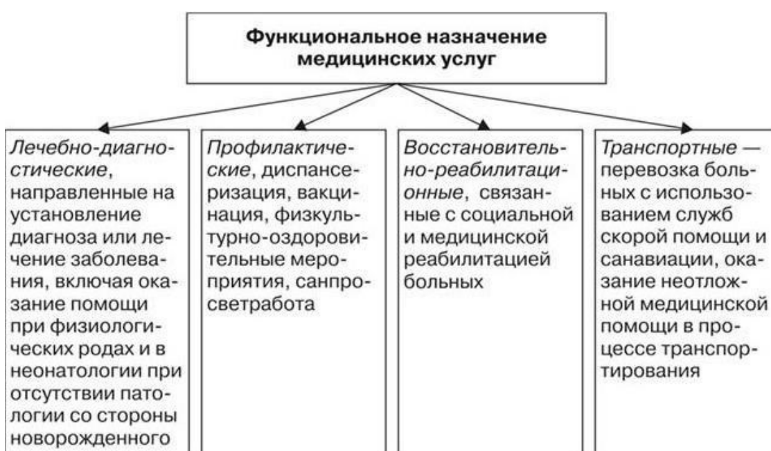
Схема 2. Медицинские услуги