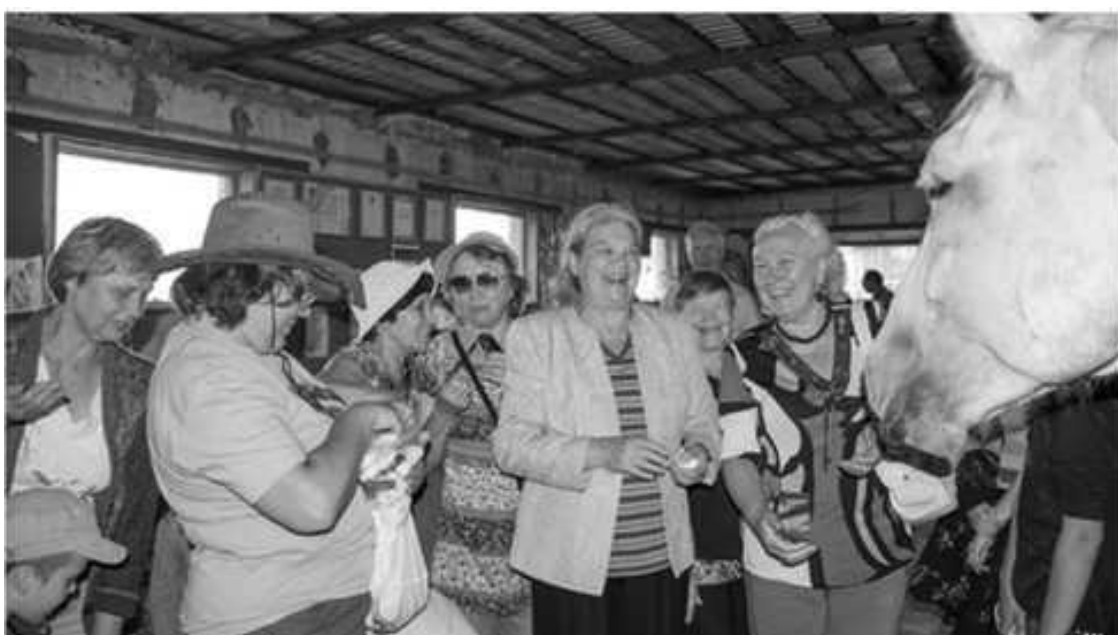
Сотрудничает с центром иппотерапии «Лучик»