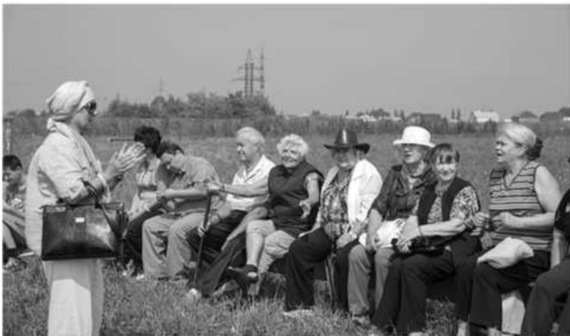
Клуб активно участвует в жизни города. Организует выездные тренинги