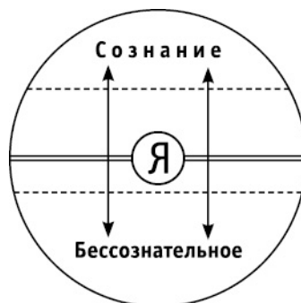
Схема 1. Сознание и бессознательное по Юнгу

Линия, разделяющая эти две области в рамках нашего «Я», может быть сдвинута в обоих направлениях – что показывают стрелки и пунктирные линии на рисунке. Конечно, положение «Я» в самом центре круга следует воспринимать как условность. Смещение разделительной линии вверх означает ограничение сознания, а вниз – его расширение.