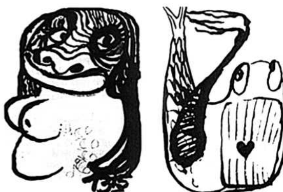
Рис. 1. Изображение «Плохой Матери», передающее испытанную во время сеанса с ЛСД глубокую регрессию на оральный уровень развития. Рис. 2. Глубокая регрессия на раннюю оральную стадию развития либидо, переживавшаяся на психоделическом сеансе. Широко зияющий рот с глоткой в форме сердца отражает характерную для этой стадии