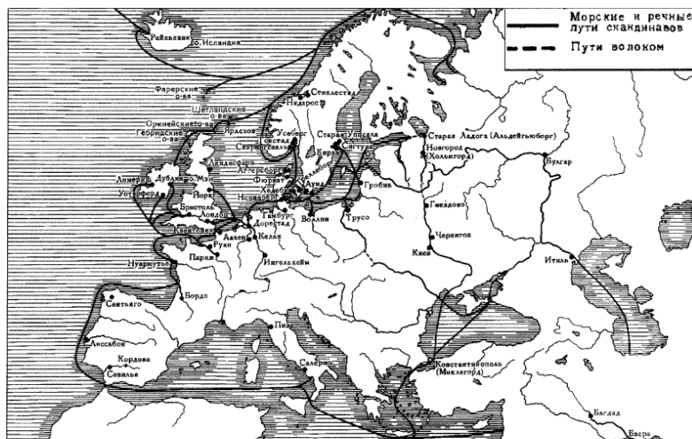
Европа в «эпоху викингов»

Естественная среда, в которой жили скандинавы, определяла не только формы их хозяйственной деятельности, но и характер поселений. В гористых, сильно пересечённых местностях Норвегии и Швеции преобладали хуторские поселения, состоявшие из отдельной усадьбы или нескольких усадеб. Зачастую хутора были разбросаны на большом расстоянии один от другого. Лишь постепенно, с ростом населения, из хуторов возникали небольшие деревни. Но и тогда сыновьям владельца хутора нередко приходилось переселяться в другую местность, если имелась возможность основать новую усадьбу. Обширные районы в гористой части Скандинавии оставались незаселёнными и ис-